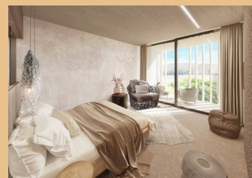
vizualizace Design Wine & Spa Hotelu KONŠELÉ